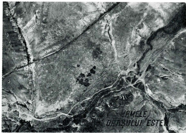
Fig. 2 Zona oraşului Ester, fotografie aeriană din 1969.

Astfel, urmele fostului oraş se găsesc pe valea Gura Dobrogei la cca 2 km înainte de confluenţa acesteia cu riul Casimcea, poziţie identică şi cu ruinele Gura Dobrogei figurate pe harta la scara 1:25.000. Se găsesc într-adevăr la poalele unui deal ale cărui cote maxime ating 150—160 m